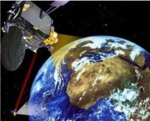
Artemis empfängt Daten per Laser von Spot 4 . (Grafik: ESA)

Was zunächst aufgrund einer Fehlfunktion der Ariane 5 -Oberstufe wie ein klassischer Fehlstart aussah hat sich mittlerweile zu einer spannenden Weltpremiere entwickelt - der europäische Kommunikationssatellit Artemis soll im Rahmen einer einzigartigen Rettungsaktion in den nächsten Monaten vor allem mit Hilfe seiner Ionen-Triebwerke doch noch die geplante geostationäre Umlaufbahn erreichen.