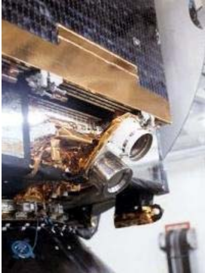
Zwei der Ionen-Triebwerke von Artemis .

Anhebung, und seit diesem Zeitpunkt musste die Flugkontrolle immer wieder auf nicht vorhergesehene Entwicklungen und Situationen reagieren, da die für die Orbit-Anhebung von Artemis entwickelten Prozeduren nur teilweise vorab getestet werden konnten. Die Grafik rechts zeigt in grüner Farbe die spiralförmig größer werdenden Umlaufbahnen, die durch Zündung des konventionellen Triebwerks im erdnächsten Punkt der Umlaufbahn (dem so genannten Perigäum ) bisher erreicht werden konnten. In einem zweiten Schritt wurde dieses Triebwerk auch im Apogäum (erdfernster Punkt der Umlaufbahn) gezündet, wodurch das Perigäum angehoben wurde. Die rot eingezeichnete Umlaufbahn ist der angestrebte geostationäre Orbit, den Artemis mit Hilfe seiner vier Ionen-Triebwerke erreichen soll.